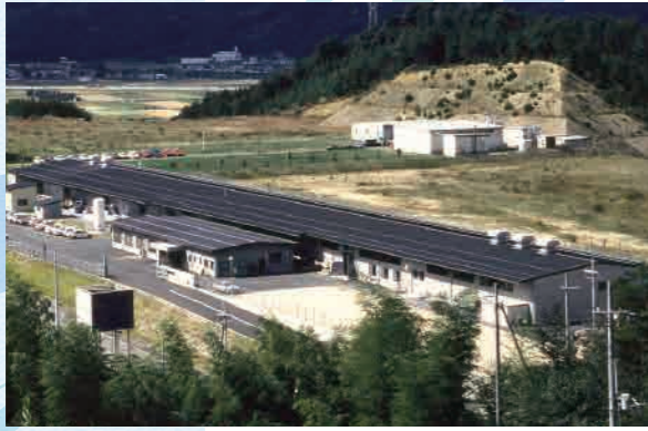
本社・和田山工場